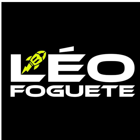
Imagem Digital da Marca

A eventual deformação desta imagem, com relação à constante do arquivo originalmente anexado, terá sido resultado da necessária adequação aos padrões requisitados para a publicação da marca na RPI. Assim, a imagem ao lado corresponde ao sinal que efetivamente será objeto de exame e publicação, ressalvada a hipótese de substituição da referida imagem decorrente de exigência formal.