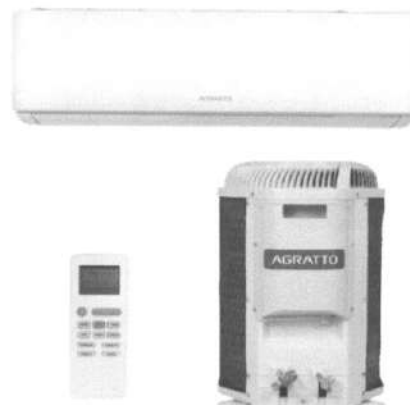
Imagem do Produto Proposto