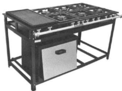
Imagem do Produto Proposto