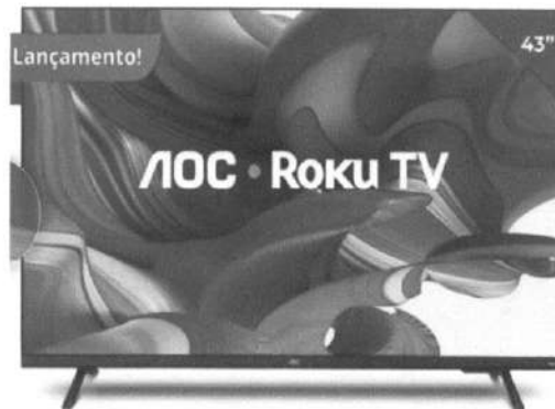
Imagem do Produto Proposto