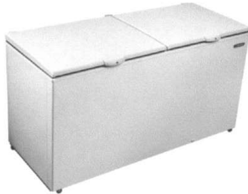
Imagem do Produto Proposto

refrigerador +2 A + 8° C, dupla função: refrigerador e freezer.