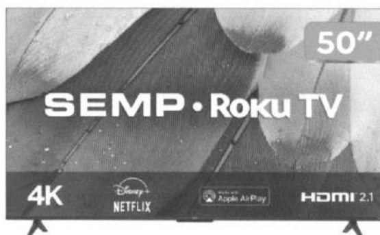
Imagem do Produto Proposto