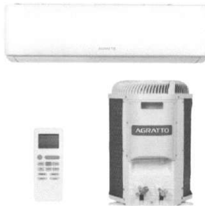
Imagem do Produto Proposto