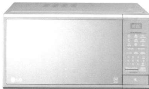
Imagem do Produto Proposto