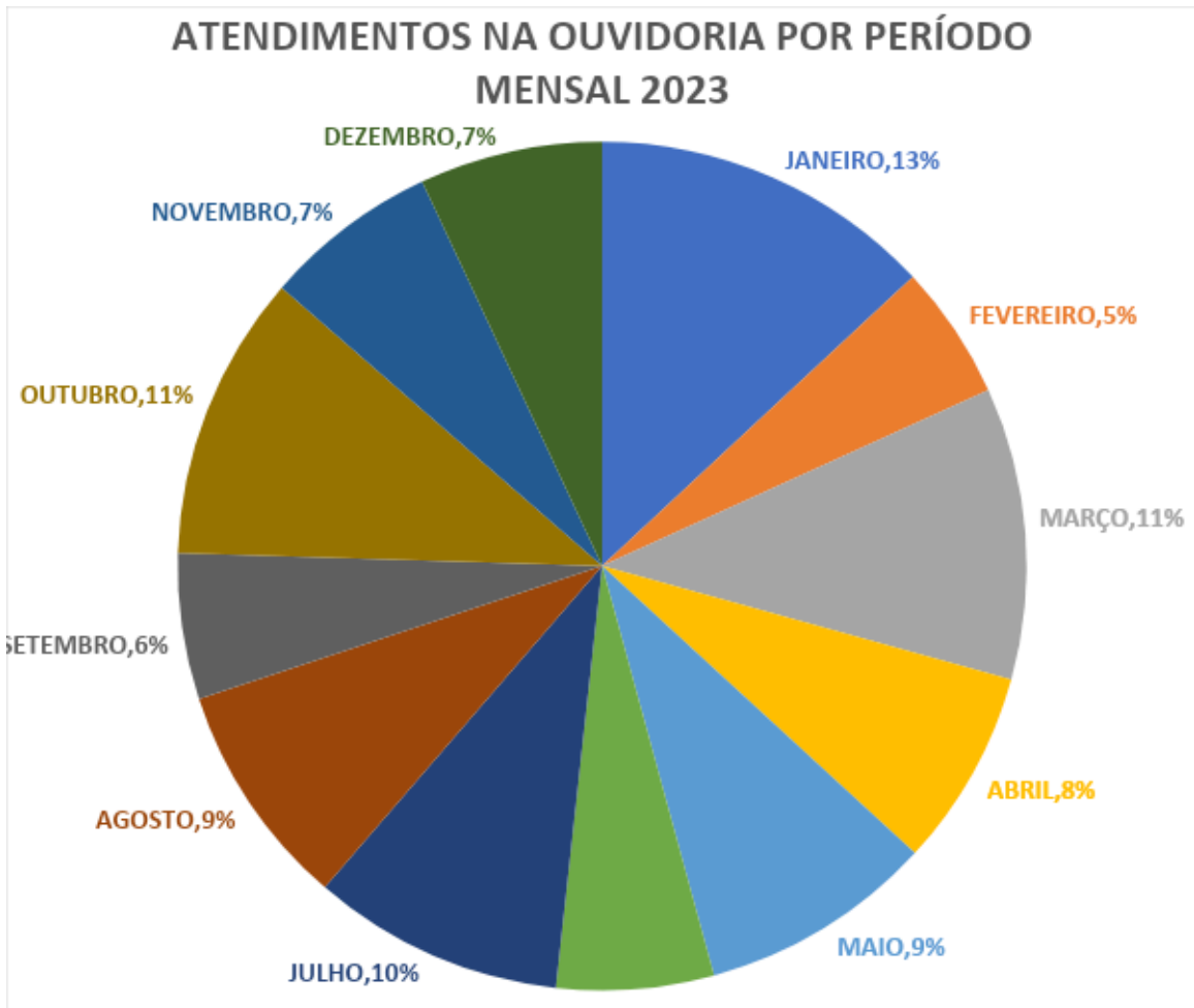
Gráfico 2: Distribuição em porcentagens das manifestações por período de atendimento.

Em relação ao período que mais houve manifestações dos usuários foi no mês de janeiro, correspondendo a 13%, seguido de março e outubro com 11% e julho com 10%.