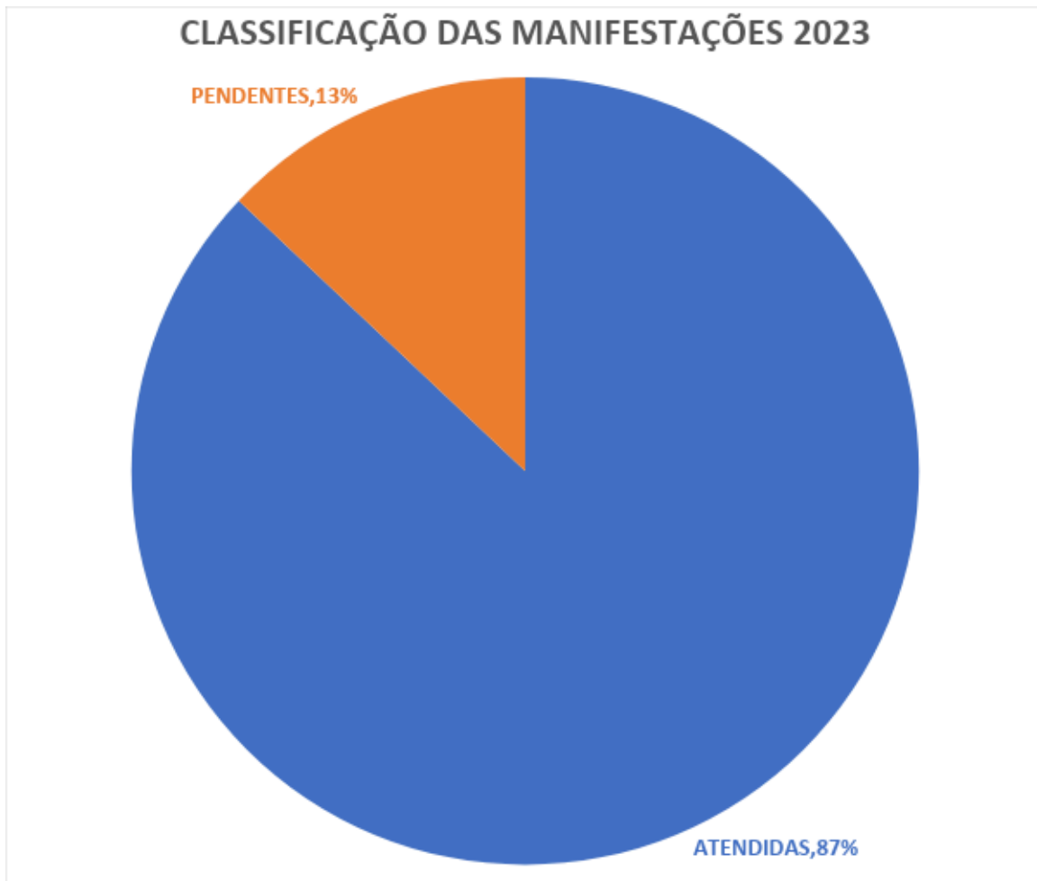
Gráfico 5. Demonstrativo do andamento das demandas.

Em observância à triagem das demandas recepcionadas, verifica-se que 87% é em relação às demandas respondidas e 13% de demandas pendentes.