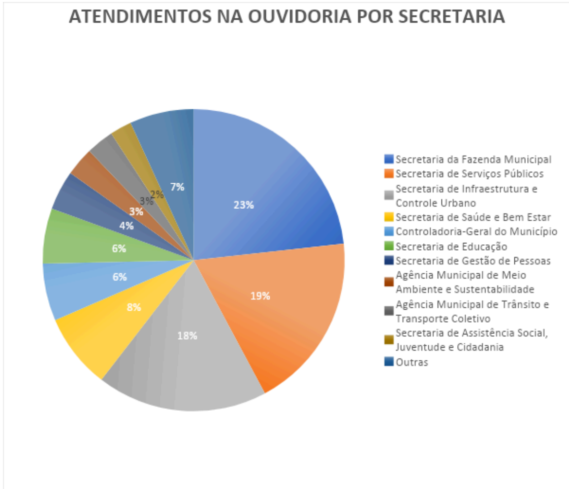
Gráfico 3: Demonstrativo dos encaminhamentos das manifestações por setor.

Em levantamento realizado em relação às secretarias que mais receberam solicitações, reclamações, elogios ou denúncias, verifica-se que a Secretaria da Fazenda Municipal recebeu maior demanda, registrando 23% da totalidade das demandas emitidas por esta Ouvidoria no ano de 2023, seguida da Secretaria de Serviços Públicos, com 19%, e Secretaria de Infraestrutura e Controle Urbano, com 18%.